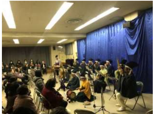
往還雅楽サークル