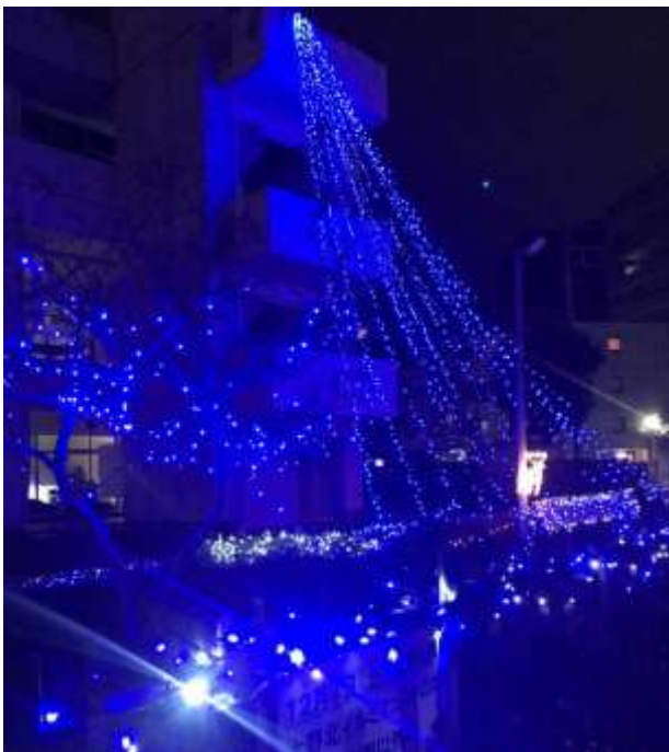
イルミネーション点灯時

シンプルな青色の輝き、漆黒の夜空に映えて感動的な 美しさです。このイルミは淵野辺駅南口の師走風景になり ましたね。