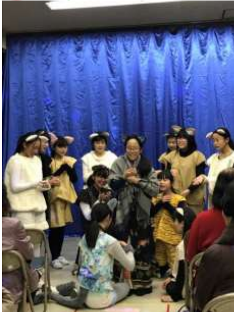
共和中学校 合唱部