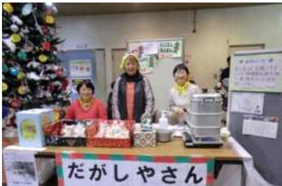
実行委員によるチャリティー販売