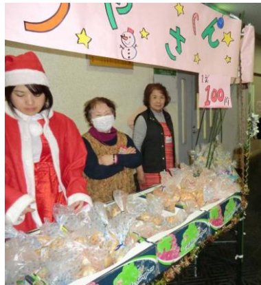
軽食チャリティー販売 (ホットドッグ・駄菓子)