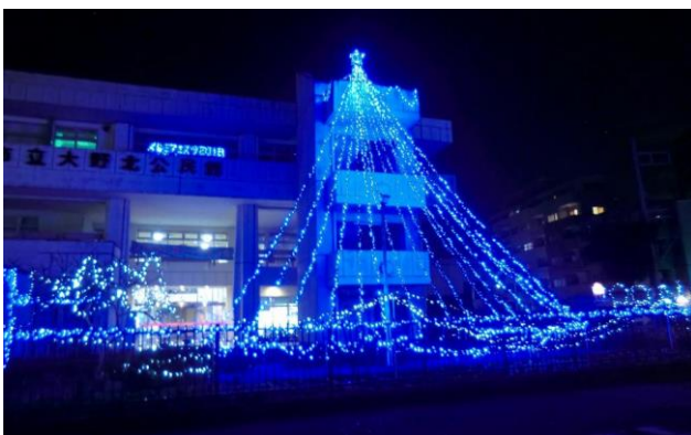
イルミネーション点灯時

12 月 8 日午後 5 時よりの点灯式には、どれだけの方に来場頂けるか、心配もありました。しかし始まってみると予想を超える来場者で盛り上がり、感動でした！今回は点灯式の後、クリスマス・ミニコンサートも行いました。また災害義援金の募金とチャリティーの軽食(ホットドッグ)販売も行い、その収益の一部を昨年 9 月の北海道胆振地震の義援金とすることが出来ました。点灯は 12 月 25 日まで行い、その間、南口にブルーの輝き、希望の光を灯してくれました。